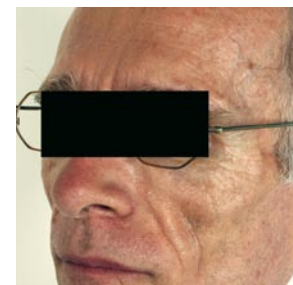
Lipoatrophie faciale avant le traitement